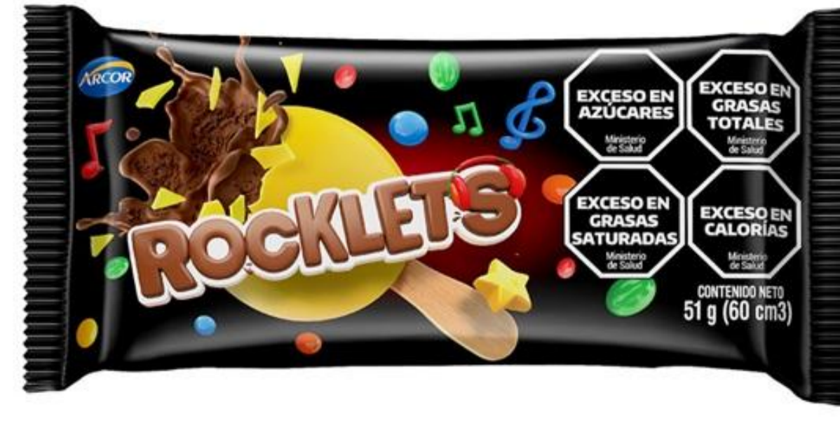
PALITO HELADO ROCKLETS 51 grs

1011316 HELADO ROCKLETS COLORES 16U X 60CC