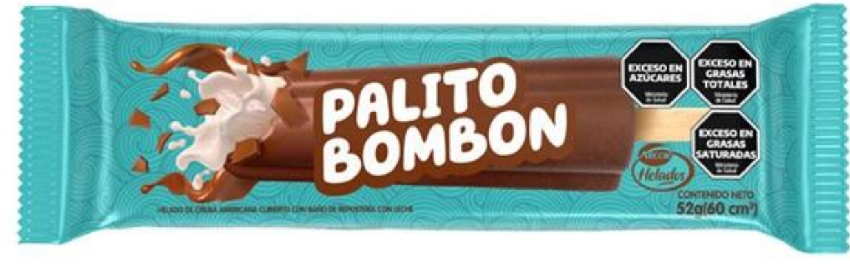
PALITO BOMBÓN ARCOR 52 grs

1011316 HELADO ROCKLETS COLORES 16U X 60CC