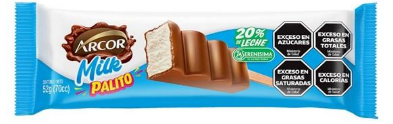
PALITO DE CREMA ARCOR MILK 52 grs