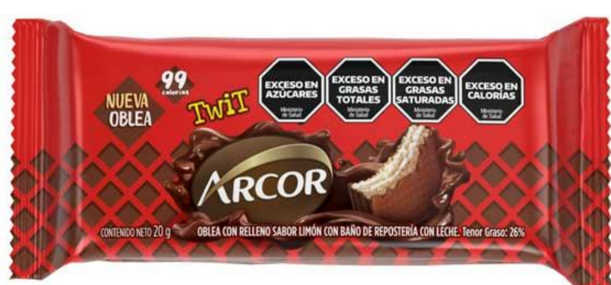
Oblea ARCOR 20 grs