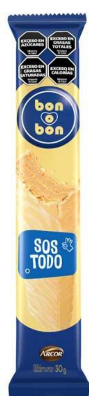
Oblea Chocolate blanco BON o BON 30 grs