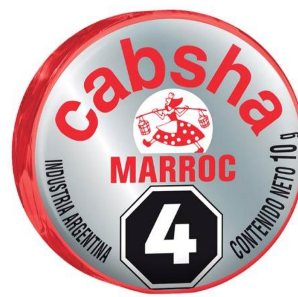
Bocadito Marroc CABSHA 10 grs