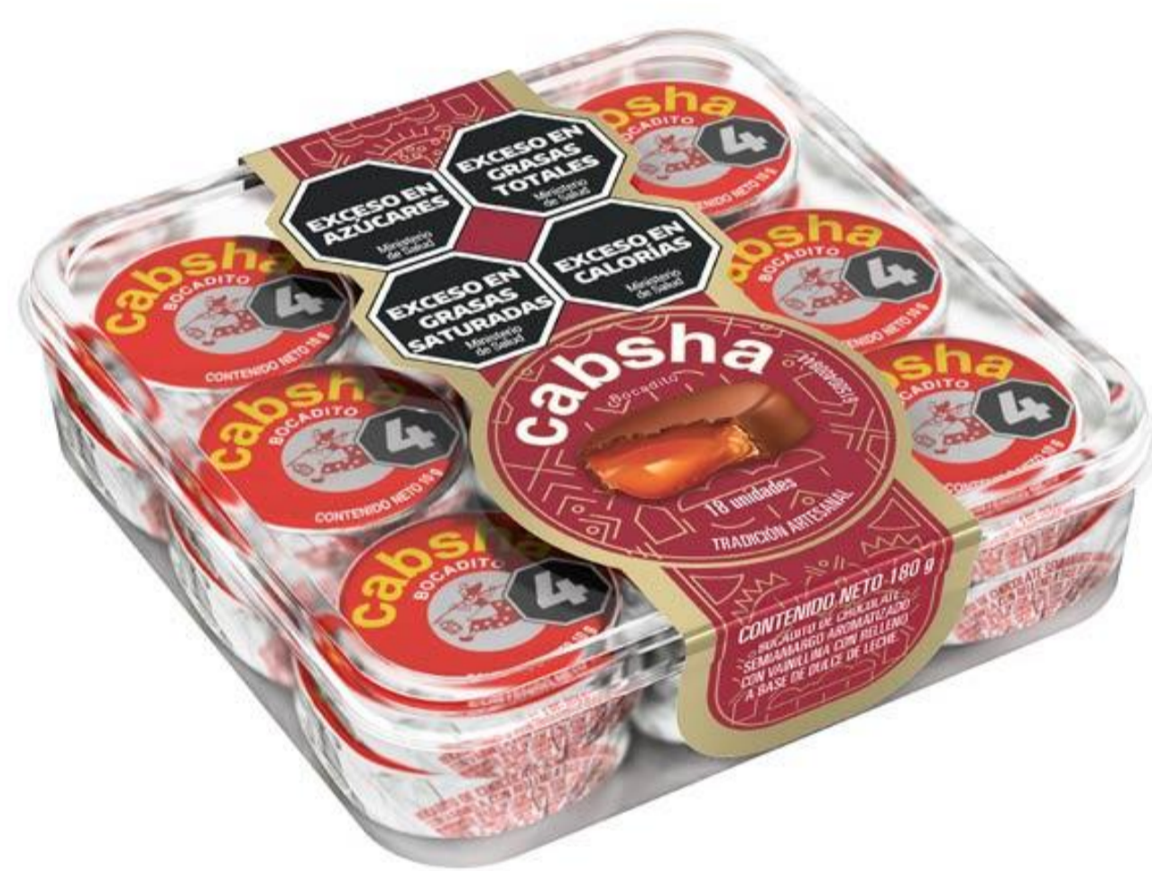
Bocadito CABSHA 180 grs