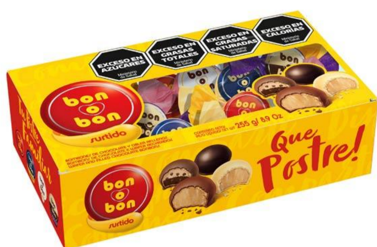
Bombones Surtidos BON o BON 255 grs