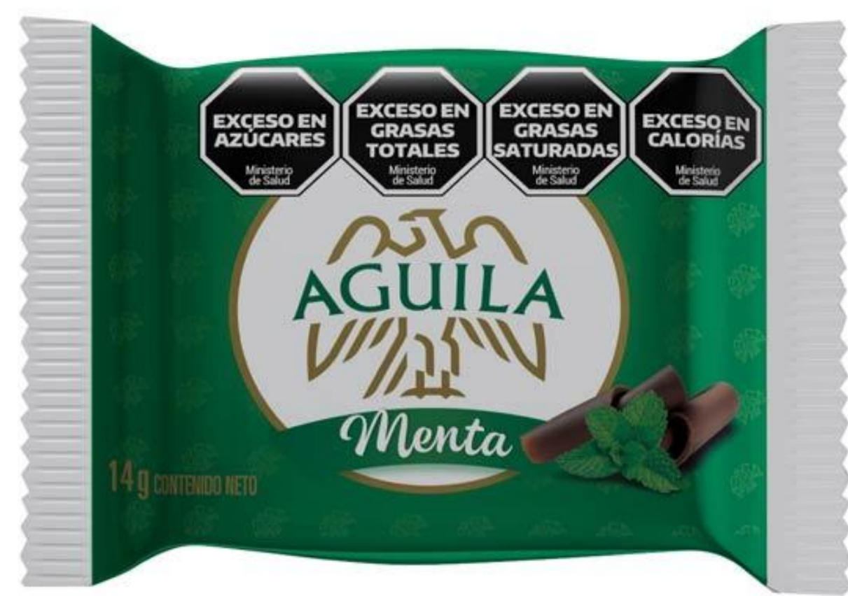
Medallón Menta AGUILA 14 grs