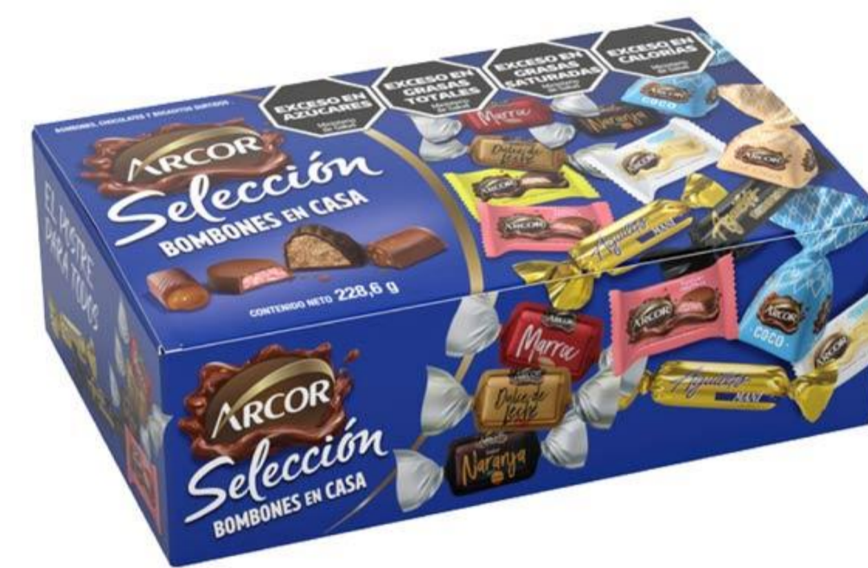
Bombones Surtidos ARCOR 228 grs