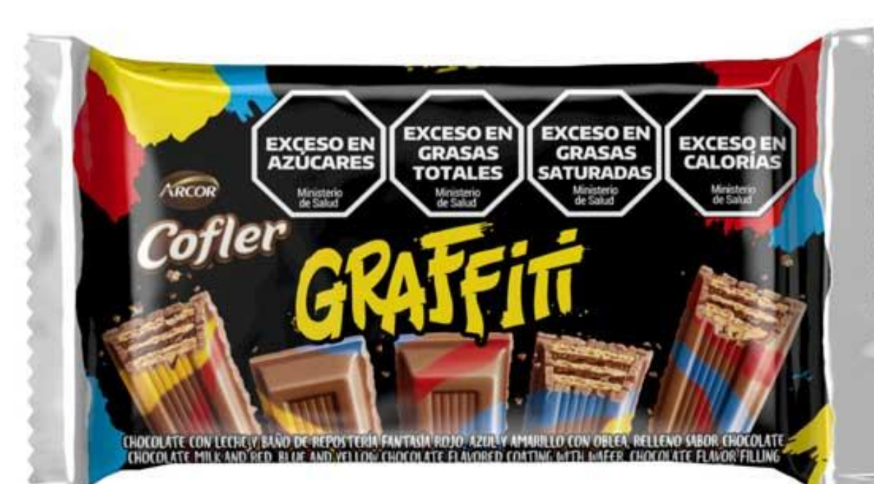
Chocolate con leche GRAFFITI 45 grs