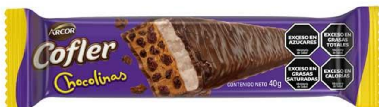
Barra Chocolinas COFLER 40 grs