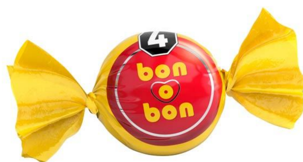
Bombón Leche BON o BON 15 grs