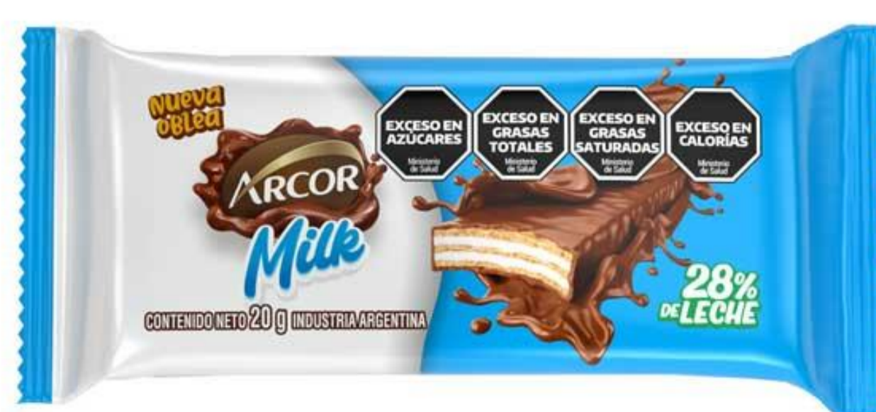
Oblea ARCOR MILK 20 grs