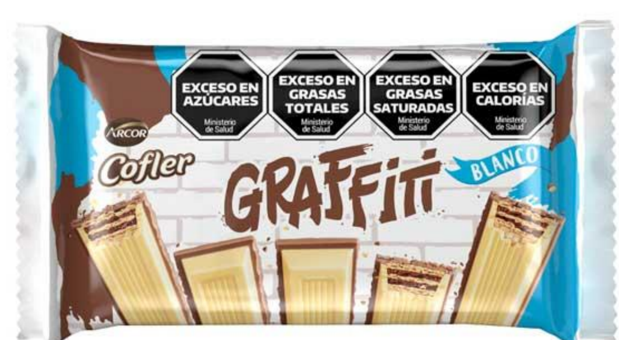
Chocolate blanco GRAFFITI 45 grs