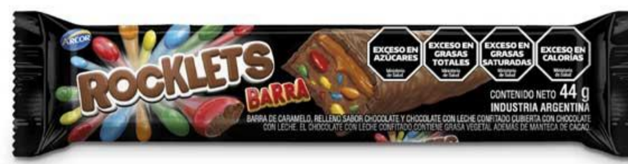
Barra de caramelo ROCKLETS 44 grs