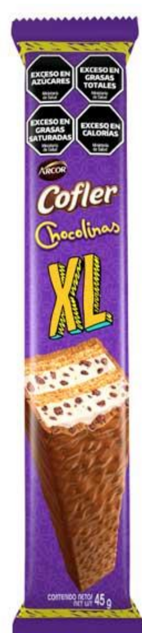
Oblea COFLER CHOCOLINAS XL 45 grs