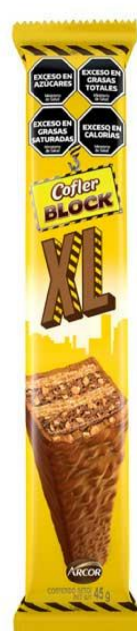
Oblea COFLER BLOCK XL 45 grs