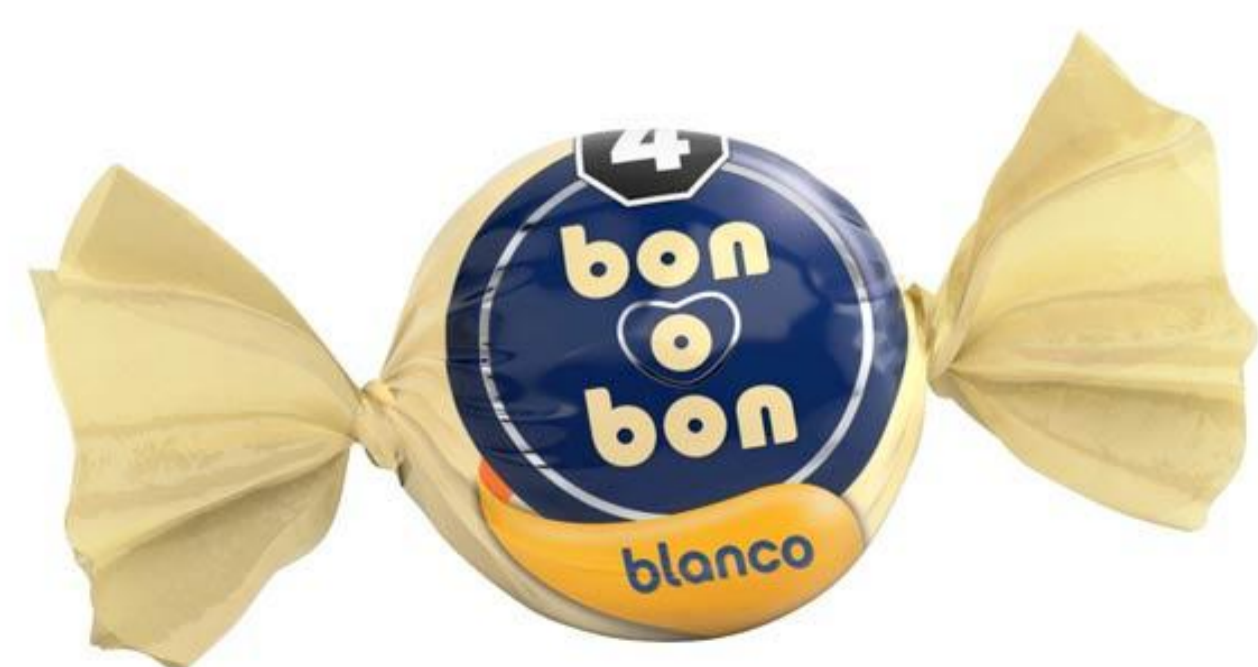
Bombón Blanco BON o BON 15 grs