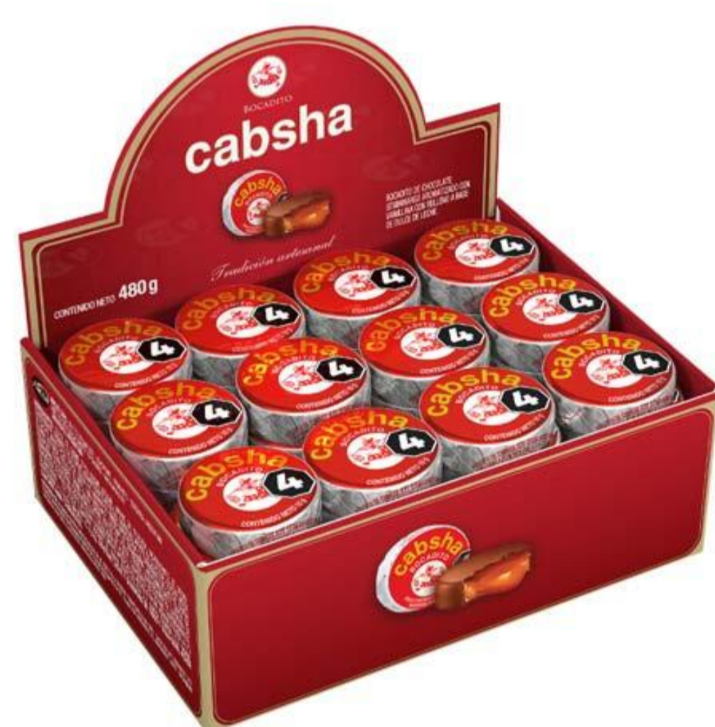
Bocadito CABSHA 480 grs