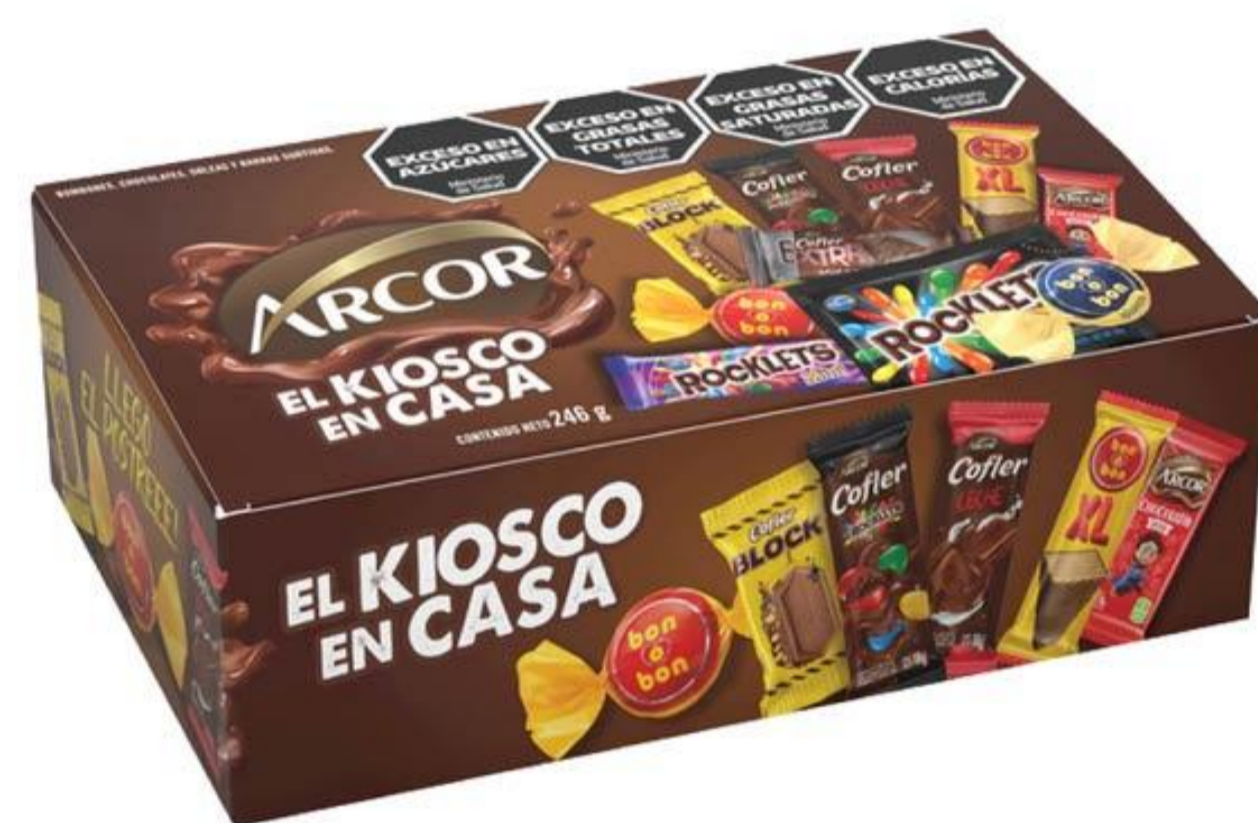
Bombones Surtidos ARCOR 246 grs