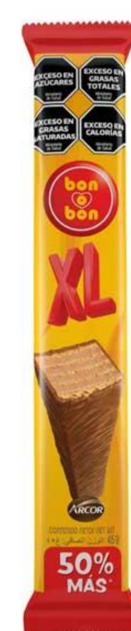
Oblea Chocolate Leche XL BON o BON 45 grs