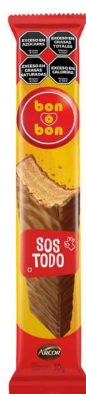
Oblea Chocolate leche BON o BON 30 grs