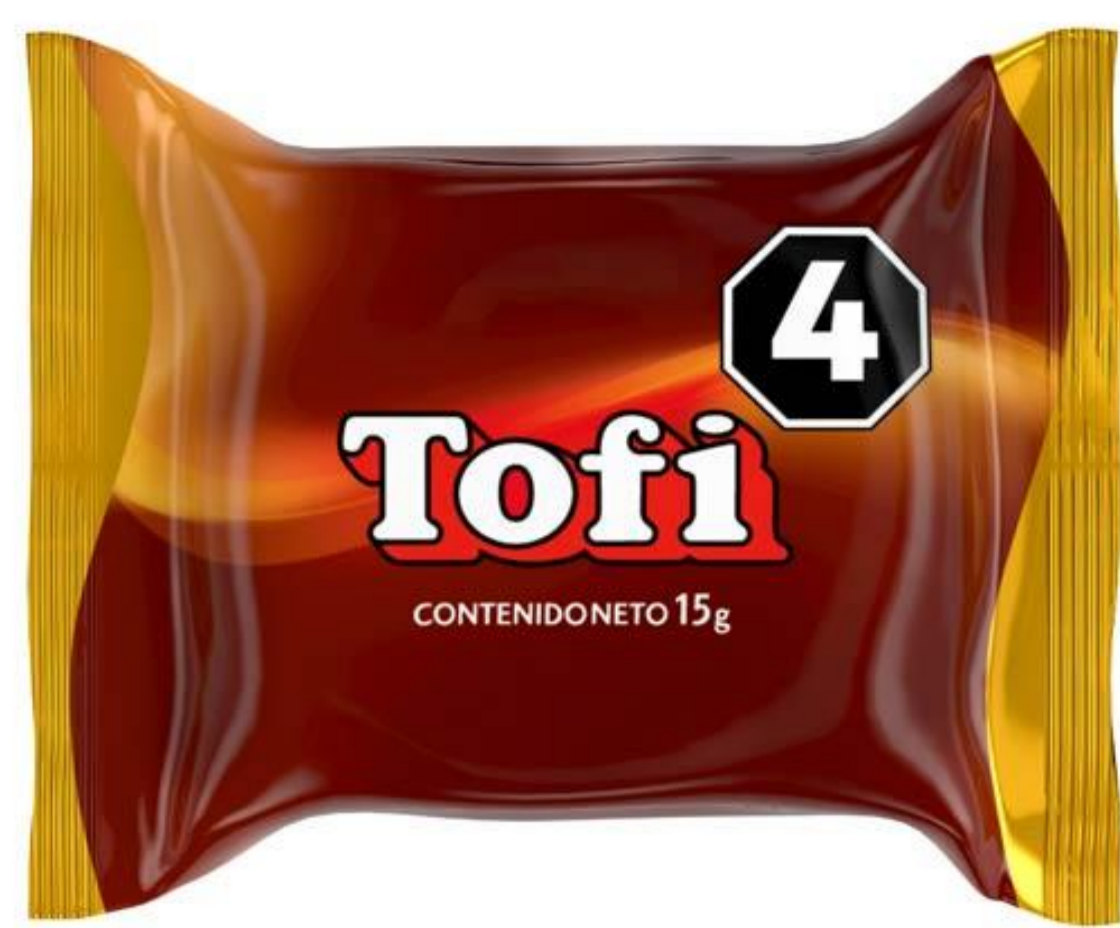
Bombón Leche TOFI 15 grs