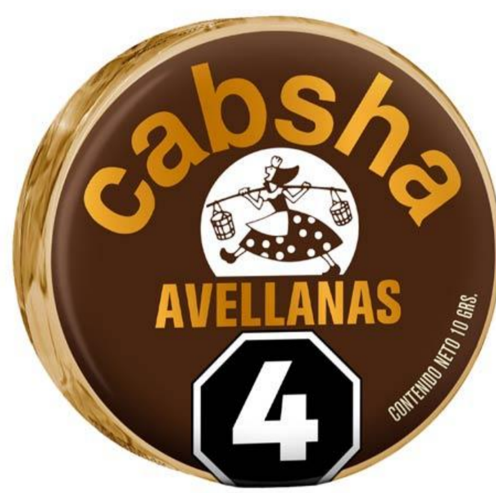
Bocadito Avellanas CABSHA 10 grs